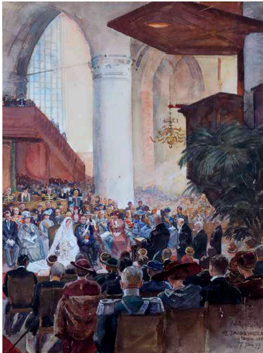
Afb. 12 Willy Sluiter, Huwelijk prinses Juliana en prins Bernhard, aquarel, 1937.

het huwelijk inzegent en de andere, fraai uitgewerkte aquarel toont een overzicht van de plechtigheid in de Grote of St. Jacobskerk in Den Haag (afb. 12). De inzegening zou volgens een aantekening in de inventaris van de Koninklijke Verzamelingen in opdracht zijn gemaakt, maar Sluiter was niet aanwezig bij het huwelijk en zal zich voor het maken van deze aquarellen dus gebaseerd hebben op foto's. 27 Voor de aquarel van de inzegening zal Sluiter vermoedelijk de foto die Erich Salomon maakte als voorbeeld hebben gebruikt. Uit 1937 dateert ook een klein pastelportret waarop Wilhelmina met een mutsje op is weergegeven.