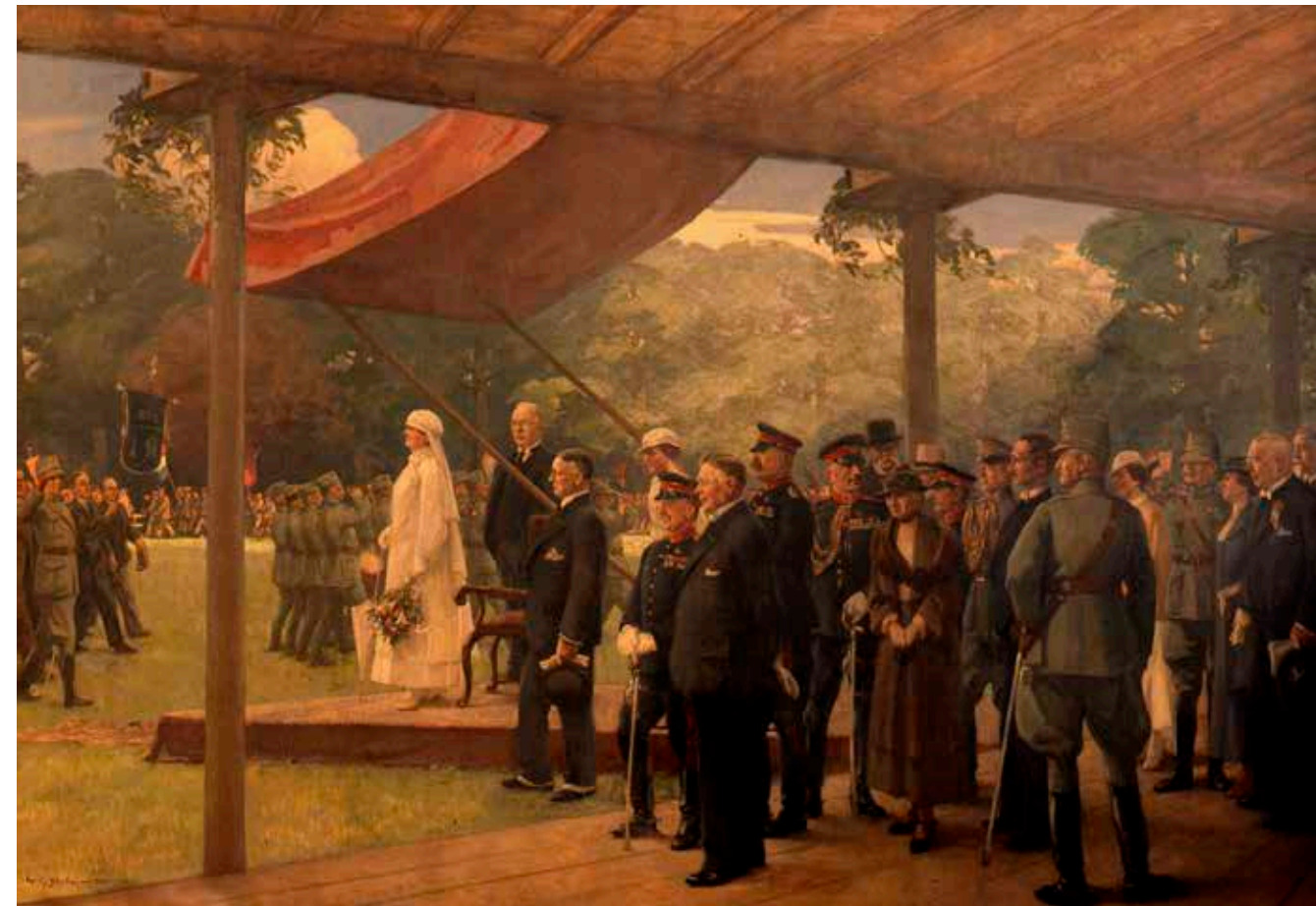
Afb. 11 Willy Sluiter, Bezoek van koningin Wilhelmina aan de Landstormdag op landgoed Schaffelaar te Barneveld op 17 juni 1935 , olieverf op doek, 1936. KONINKLIJKE VERZAMELINGEN, DEN HAAG

In de tussenliggende jaren maakte Sluiter ook andere werken die gerelateerd zijn aan het Oranjehuis. In de atelierverselling van 1951 werd bijvoorbeeld een aquarel geveild waarop de begrafenis van prins Hendrik is weergegeven. Helaas is hiervan geen afbeelding bekend. Op de tweede atelierverselling in 1952 was een kniestuk uit 1933 te vinden, waarop prins Hendrik in burger gekleed en met een hoed op in een landschap is weergegeven.