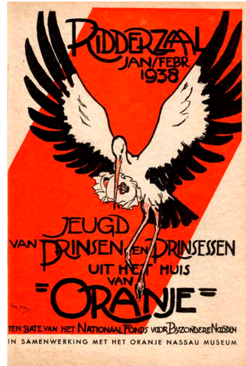
Afb. 13 Cover van de catalogus van de tentoonstelling De jeugd van prinses en prinsessen uit het Huis van Oranje , 1938.

In de maanden januari en februari 1938 werd er in de Ridderzaal in Den Haag door het Nationaal Fonds voor Bijzondere Nooden ten bate van dat fonds een twee weken durende tentoonstelling geor-