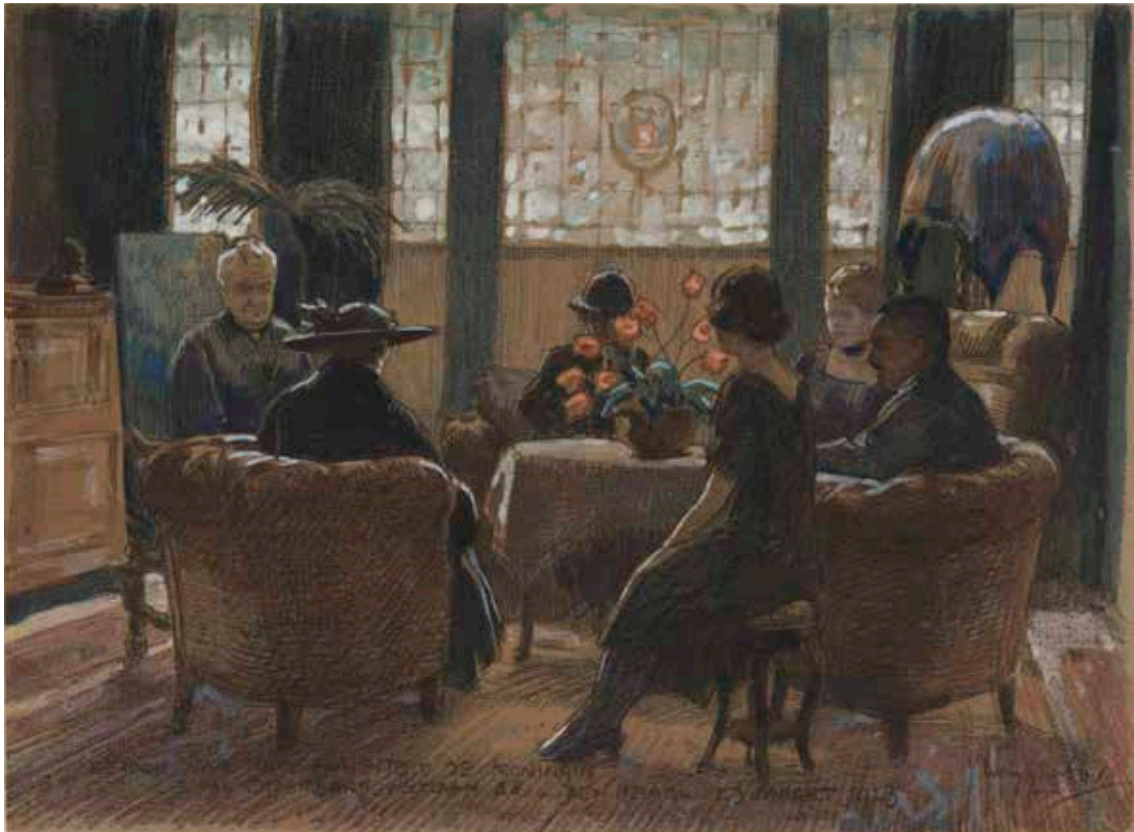
Afb. 2 Willy Sluiter, Bezoek van Hare Majesteit koningin Wilhelmina, aan zijn woning in de Johan van Oldenbarneveltlaan 68 te Den Haag op 23 maart 1923 , pastel, 1923.