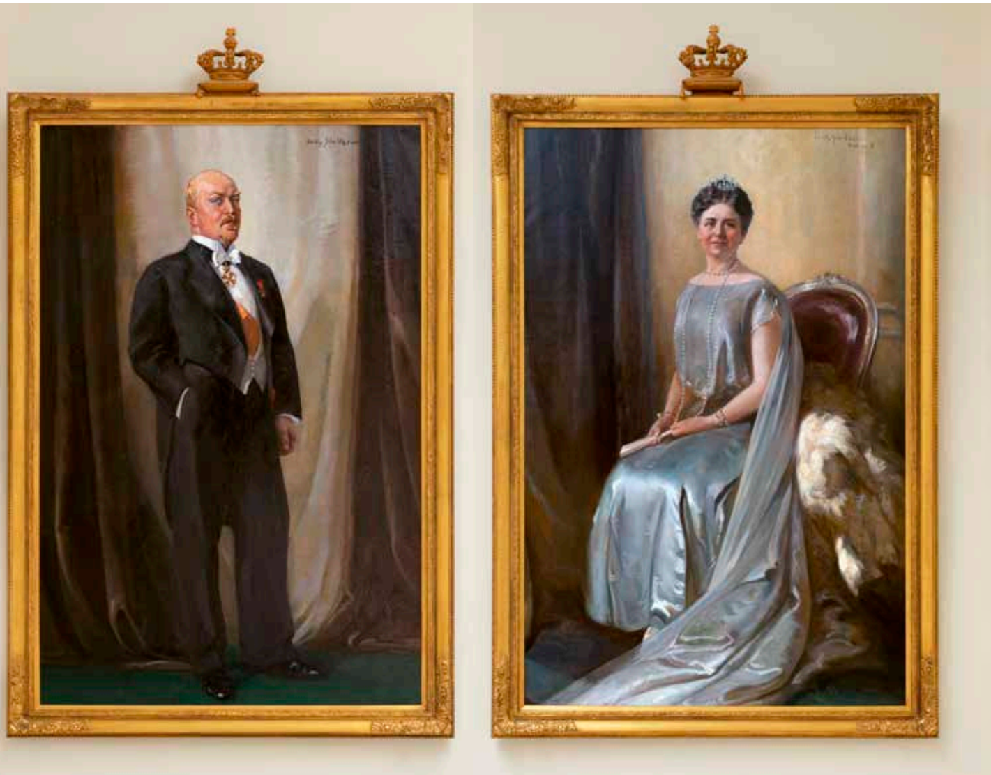
Afb. 5 Willy Sluiter, Portret van prins Hendrik , olieverf op doek, 1926. NIEUWE OF LITTÉRAIRE SOCIËTEIT DE WITTE, DEN HAAG