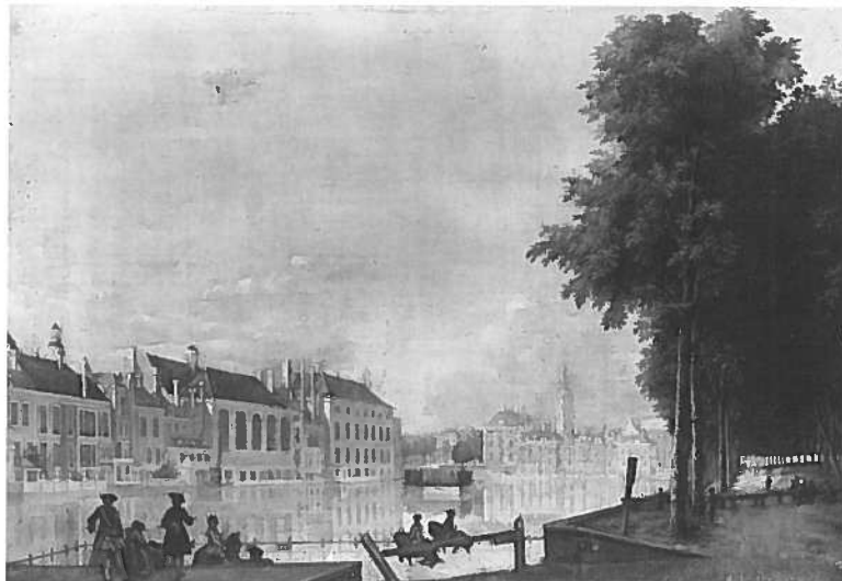
4. Johannes Merken (ca. 1725 - na 1755), Gezicht op het/View of the Binnenhof en de/Hofvijver in Den Haag/in The Hague , m.o. get. en ged./signed and dated lower middle 1755, doek/canvas 39 x 55 cm., coll. Haags Historisch Museum, Den Haag/The Hague

Een ander gezicht op de Hofvijver bevindt zich in de collectie van het Haags Historisch Museum en is 1755 gedateerd 17 (afb.4). Vanaf de hoek Korte-Lange Vijverberg, precies bij de ingang van het paardenwed, kijken wij over de Hofvijver op de Binnenhofgebouwen. Aan de overzijde van de Hofvijver ziet men nog de oude huizen die in 1921 moesten wijken voor de verkeersweg Vijverdam. Erachter staat duidelijk herkenbaar de 'Haagse Toren' van de Grote of St. Jacobskerk. Rechts van de Hofvijver zien we de voorname promenade met de ook nu nog bestaande bomen aan de Lange Vijverberg. Op de veiling in 1799 waarop dit stuk voorkwam was het samen met de tegenhanger 'een gezigt van het Buitenhof naar het Hof te zien'. Mogelijk dat