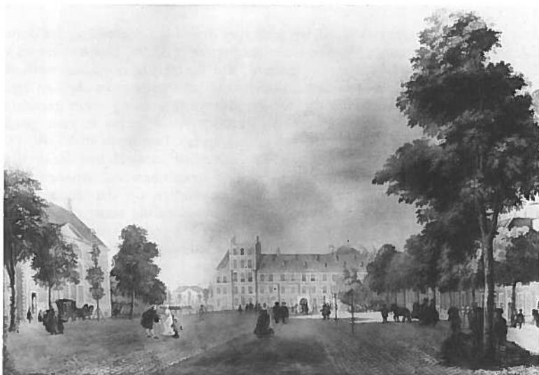
5. Johannes Merken (ca. 1725 - na 1755), toegeschreven/attributed, Gezicht op het/View of the Buitenhof en het/and the Stadhoudersplein te/in Den Haag/The Hague , doek/canvas 37,5 x 53 cm., verblijfplaats onbekend/residence unknown