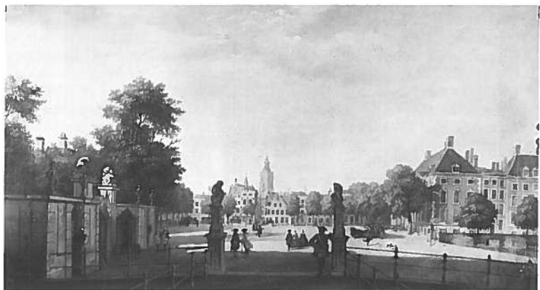
6. Johannes Merken (ca. 1725 - na 1755), Gezicht op het/View of the Buitenhof vanaf het/from the Stadhoudersplein te/in Den Haag/The Hague , r.o. get. en ged./signed and dated lower right 1754, doek/canvas 34,5 x 64 cm., coll. Schloss Dessau