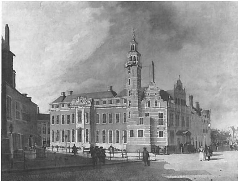
2. Johannes Merken (ca. 1725 - na 1755), Gezicht op het/View of the Oude Raadhuis van Den Haag/of the Hague , l.o. get. en ged./signed and dated lower left 1753, doek/canvas 51 x 67 cm., coll. Haags Historisch Museum, Den Haag/The Hague