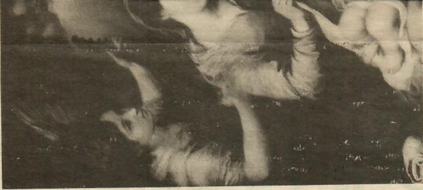
Bij de aankoop van deze Murtheby's op 1 juni, tijdens de veiling van 128 schilderijen uit de nalatenschap van Walter P. Chrysler Jr. de ene recordop-

Hier ligt een van de voornaamste redenen van de ineens losgebarsten hausse in Oude Meesters. Na het Pontormo-suc-