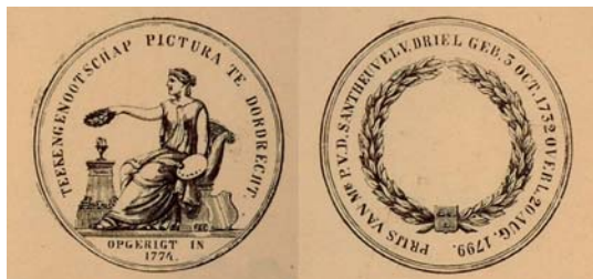
Lithografie van de prijspenning van Pictura, in 1863 ingesteld ter vervanging van de oudere penningen. 1864, steendruk op papier, diameter 50 mm (collectie: Regionale Archiefdienst Dordrecht, inv. 551_11247) 7