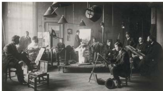
Leden van Pictura tekenen naar een levend model. Circa 1915-1925