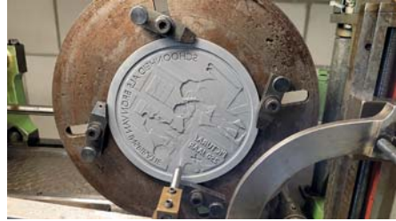
Het maken van de penning in het atelier van Venrooy Goud- en Zilverindustrie B.V. te Den Bosch